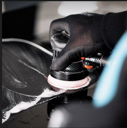
EXTERM FEINES SCHLEIFBILD