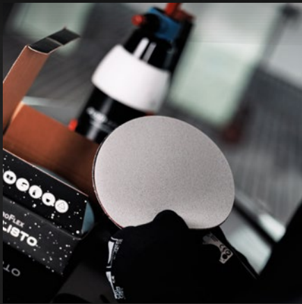
EXTREM LANGE STANDZEIT